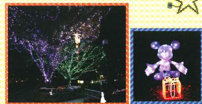
「憩いの広場」を1万球を超える電飾で飾りつけました。 11月から1月まで点灯しています。