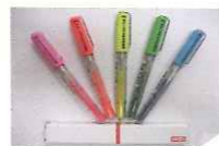
熊本ロゴマーク入りペン