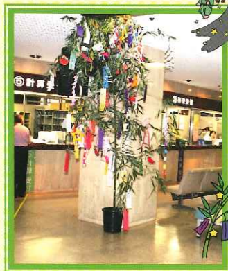
みんな短冊に願いごとを書きました。