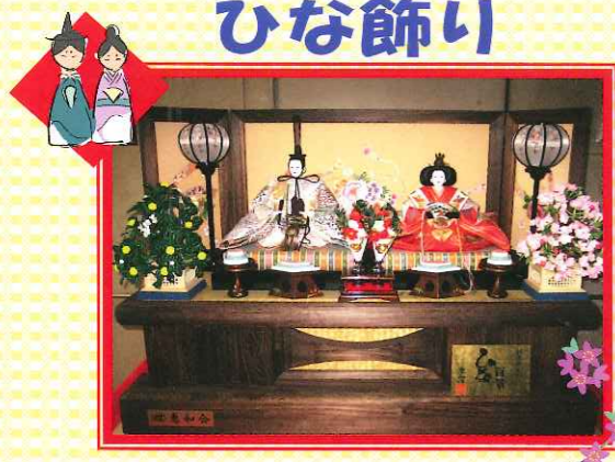
外来診療棟・中央診療棟ロビーに飾っています。