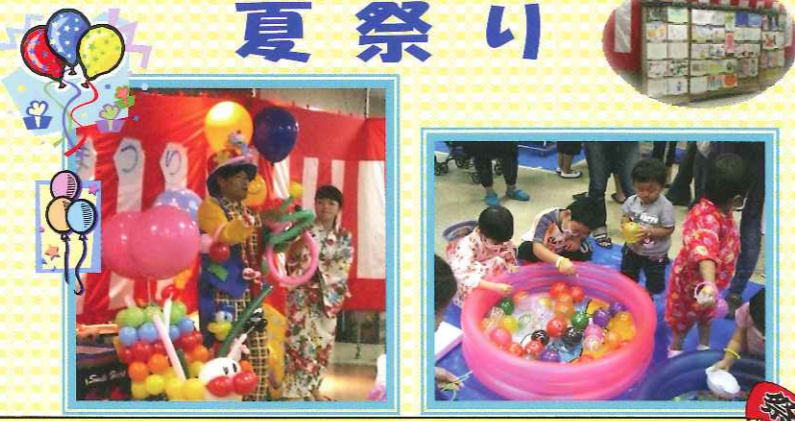
外来診療棟ロビーで「ちっちゃな夏祭り」を開催！ バルーンアートショーや綿菓子・ヨーヨー釣りなど入院中 の子供さんに楽しんでもらいました。