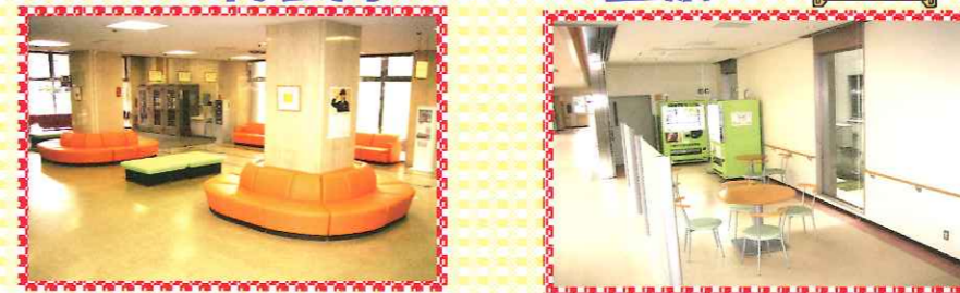
外来診療棟ロビーのイスを 張り替えました。