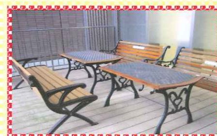
中央診療棟1階のウッドデッキに テーブルとイスを設置しました。