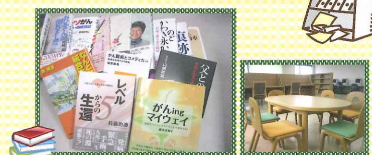
東病棟12階図書室の本の整備費を寄贈しました。