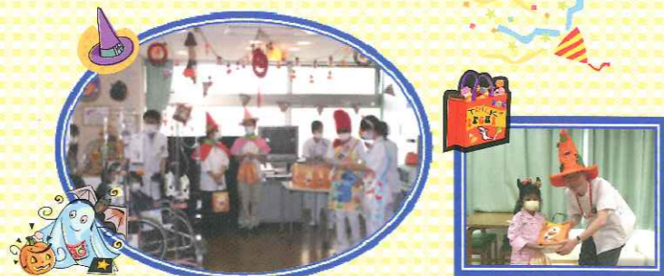
東西8階の小児用病棟プレイルームにハロウィンの飾り付け 入院中の子供さんにかぼちゃのパン等をプレゼント!!