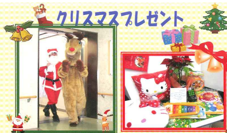
入院中の子供さん及びこばと保育園の園児さんに サンタとトナカイがプレゼントを配りました。