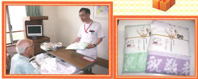
65歳以上の方へ バスタオルをプレゼント!!