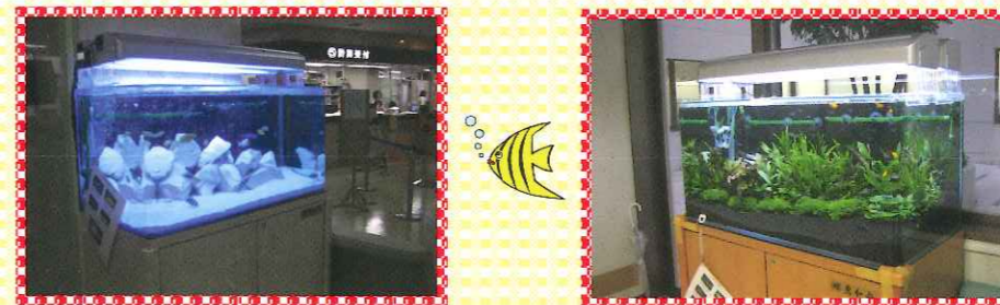
外来診療棟ロビーと東病棟1階に熱帯魚の水槽を寄贈しました。